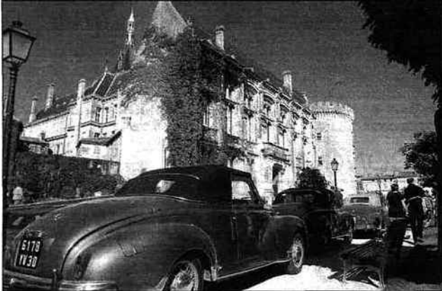
Dans les jardins de l'hôtel de ville, les 203 s'exposaient en ligne pour leur 60 e anniversaire.