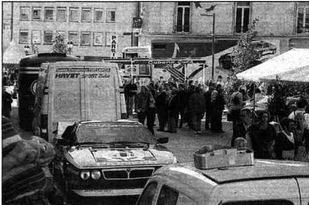
Sur la place de l'hôtel de ville rénovée, voitures et visiteurs se côtoyaient.