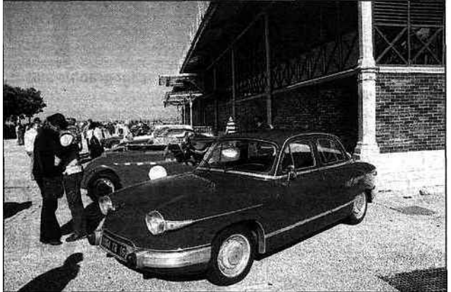
Place des Halles, Panhard et autres curiosités.