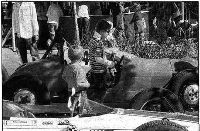
Les belles mécaniques font rêver à tous les âges.