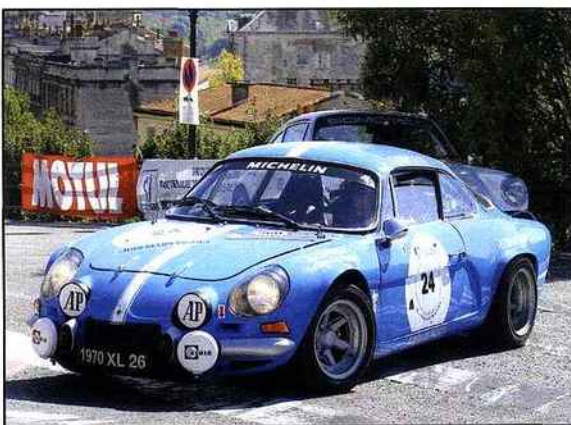
Après une lutte acharnée face à la Porsche de Langin, Erik Comas impose son Alpine A110 Groupe 4 en Catégorie gt/gts/gtp

E-C : « Je suis venu par la route sur cette épreuve avec cette Berlinette qui est équipée rallye. C'est une voiture qui participe au Tour Auto mais finalement ce type de circuit est idéal pour elle. Je vais faire le maximum pour tirer mon épingle du jeu et surtout lors des qualifications, afin de pouvoir être le mieux placé sur la grille de départ. » ●